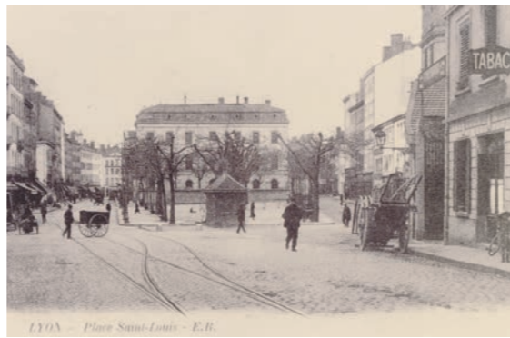
Place Saint Louis en 1904, un espace piéton.

et les réseaux sociaux, c'est peut-être parce que ce sont les derniers espaces d'autonomie qui leur restent. Quels adultes faisons-nous grandir dans ces conditions ? Au Conseil de quartier, nous pensons que ce n'est pas une fatalité de condamner nos enfants à rester enfermés jusqu'au collège voire au lycée ! Rejoignez-nous pour rendre la rue à nos enfants, et par la même occasion, agissons pour que l'espace « public » le soit vraiment, qu'il redevienne un lieu de rencontre et de lien social pour toutes et tous. Le conseil de quartier Guillotière