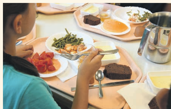
Cantine de l'école Gilbert Dru

Derrière la coupelle de cerises en juin, c'est tout un monde de l'alimentation durable qui joue sa partition !