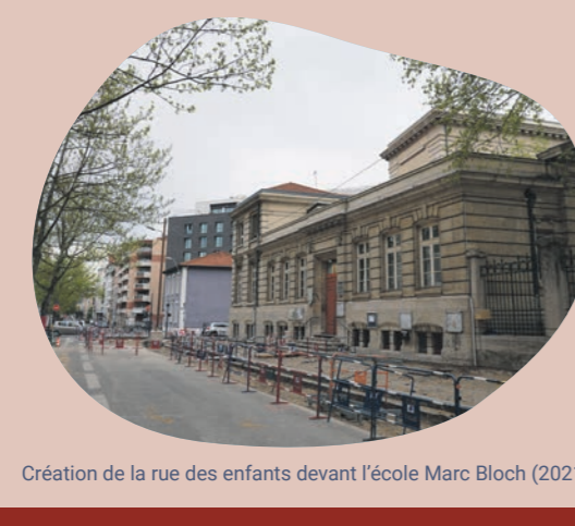
Création de la rue des enfants devant l'école Marc Bloch (2021)