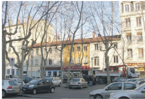
Place Saint Louis en 2020, un espace de parking.

... à la fin de l'école primaire Lorsque les enfants sont plus grands, la Mairie reste l'interlocuteur-clé pour les parents, qu'il s'agisse de préinscrire un enfant à l'école (pour les 1 ères entrées à l'école ou pour les arrivées sur Lyon), d'inscrire un enfant à la restauration scolaire ou aux activités périscolaires, de faire calculer le quotient familial (sur lequel est basé le tarif applicable), ou encore de demander une dérogation au périmètre scolaire.