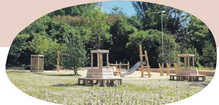
L'aire de jeux du parc des berges

N'oublions pas, le jeu est l'activité principale de l'enfant. Incitons-les à aller jouer, regarder, toucher, expérimenter, créer, rêver, manipuler, tout simplement grandir !