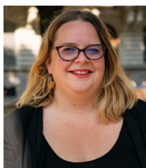
Fanny DUBOT Maire du 7 e arrondissement