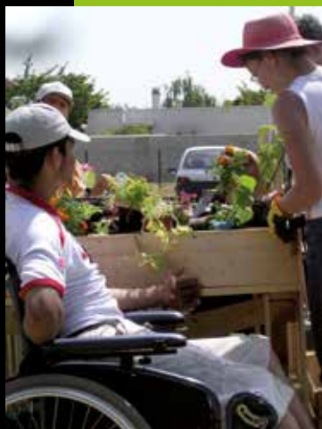
exemple d'un bac adapté