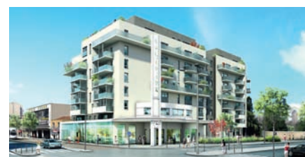
Le projet de reconversion de la station-service des Hirondelles

Mais l'identité du 7 e , c'est aussi un patrimoine vivant, à l'image des jeux de boules. Sans oublier le patrimoine de quartier, comme le carillon et l'orgue de l'église Notre-Dame Saint-Louis, dont vous pourrez lire l'histoire dans ce numéro de 7'Actuel. Tout en respectant notre identité historique, architecturale et artistique, nous contribuons à construire l'arrondissement et la ville de demain. ■