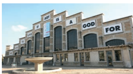
La Halle Tony Garnier

Avec ses grandes écoles et son Biopôle spécialisé dans les sciences du vivant, on dit souvent que Gerland est un territoire du savoir, tourné vers les technologies du futur. Mais l'histoire de l'arrondissement a épousé nombre de changements, qui lui ont conféré une identité forte. A l'époque gallo-