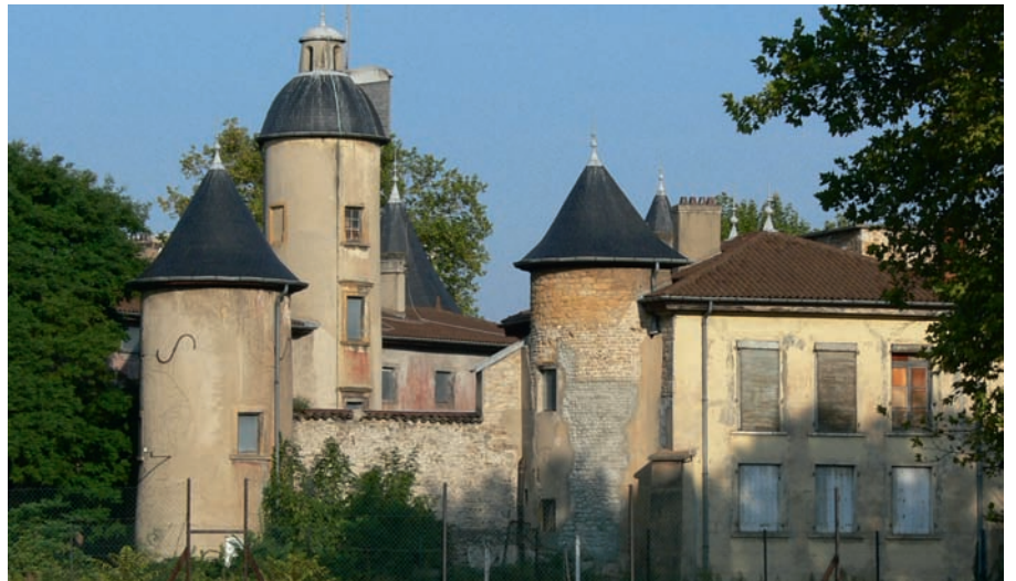
Le château La Motte, au cœur du Parc Blandan, inscrit aux monuments historiques

Elles assurent la protection d'un patrimoine paysager et urbain homogène. Elles sont mises en œuvre à l'initiative d'une commune ou d'un établissement intercommunal et elles doivent faire suite à une consultation du public. Il en existe cinq dans le Rhône, dont les pentes de la Croix-Rousse.