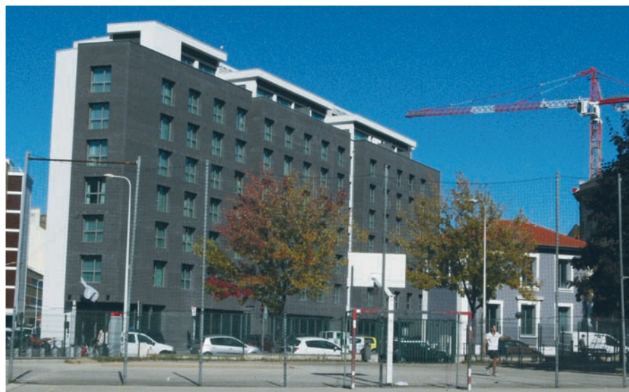
L'hôtel Mama Shelter près de Jean Macé

En cette année 2013, pour les cent ans de la première loi sur la protection du patrimoine et le trentième anniversaire des Journées européennes du patrimoine, la concertation relative au PLU-H invite à s'interroger sur l'histoire et le développement urbain : comment sauvegarder les traces architecturales et artistiques d'un passé bien présent dans nos rues, tout en développant la ville du futur ? ■