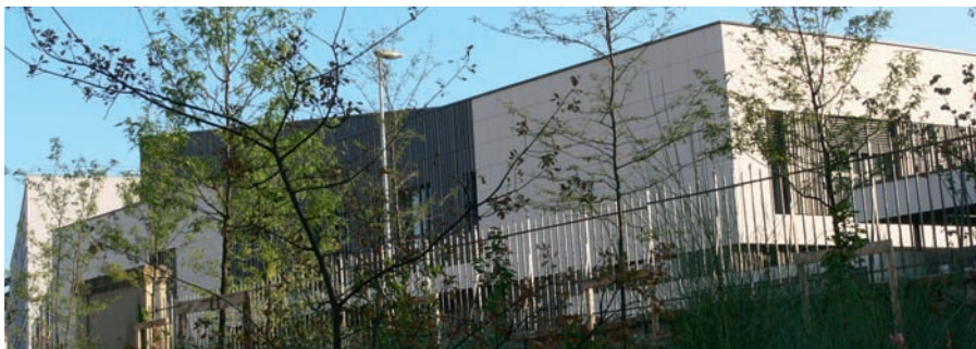
Le groupe scolaire Julie-Victoire Daubié vu depuis le Parc Blandan