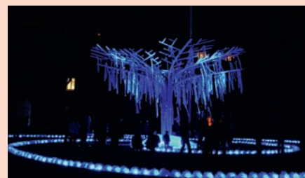
Après l'arbre aux vœux du Centre Berthelot en 2012, laissez-vous séduire par les animations de cette nouvelle édition.

Pour cette édition 2013, vous serez surpris en redécouvrant la cour du collège Belmont rue Pasteur pour une fête fantastique autour de la figure d'Arthur Rimbaud. Les façades de l'espace Mazagran se transformeront en écrans de cinéma pour accueillir des vidéos réalisées avec les habitants du quartier, inspirées de Charlie Chaplin et des Lumières de la Ville . Quais du Rhône, c'est la terrasse de l'hôpital Saint-Luc Saint-Joseph qui vous enchantera. Sans oublier la mise en lumière de la place Jean Macé.