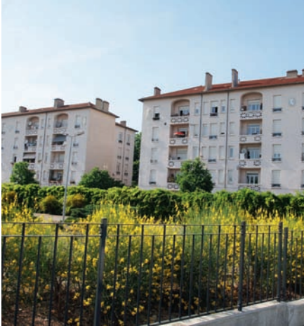
La Cité Jardin

L'année 2013 marque le centenaire d'une loi fondatrice pour la sauvegarde du patrimoine en France, la loi du 31 décembre 1913. Si plusieurs listes de sites menacés avaient été établies depuis 1842, elles n'avaient pour seule intention que de répartir le financement de travaux d'urgence.