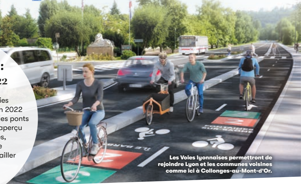
Les Voies lyonnaises permettront de rejoindre Lyon et les communes voisines comme ici à Collonges-au-Mont-d'Or.

Les premiers tronçons des Voies lyonnaises vont être aménagés en 2022 sur la rive gauche du Rhône, entre les ponts Galliéni et Churchill. Un premier aperçu de ces pistes cyclables larges, en site propre, dotées d'une signalisation dédiée qui vont mailler l'agglomération sur 250 km à l'horizon 2026.